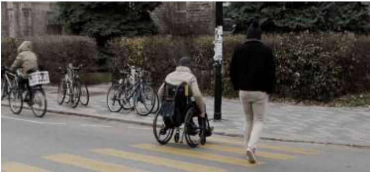
Formel, fonctionnel, universel ? https://societelogique.org/design-universel/