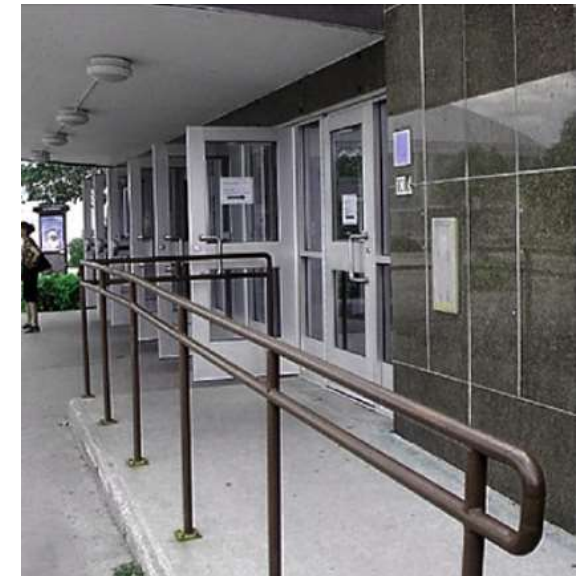
Formel, fonctionnel, universel ? https://societelogique.org/design-universel/