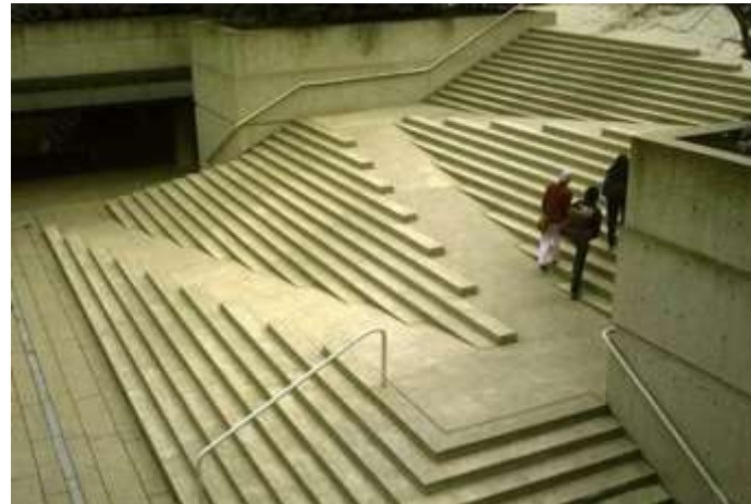
Introduction. Les applications pédagogiques de la conception universelle de l'apprentissage. http://pcua.ca/