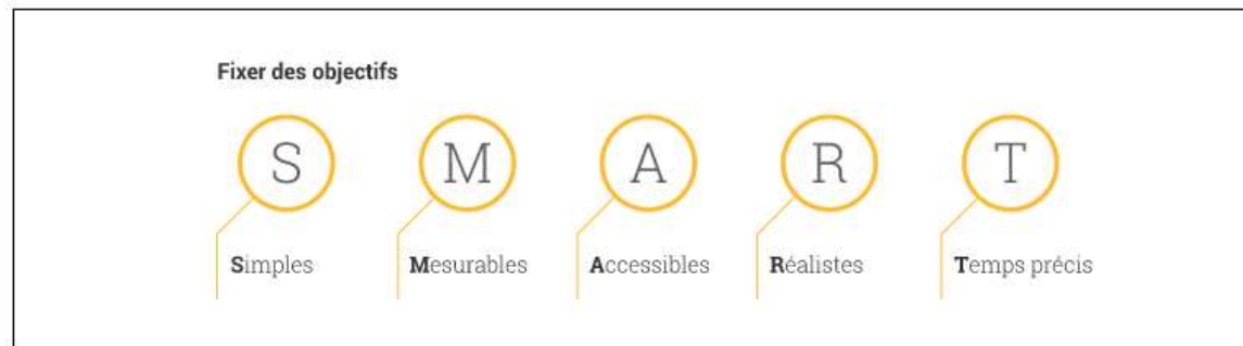
Image : Les objectifs SMART

Source : http://www.avantagesemark.com/se-fixer-des-objectifs-de-marketing-smart/ .